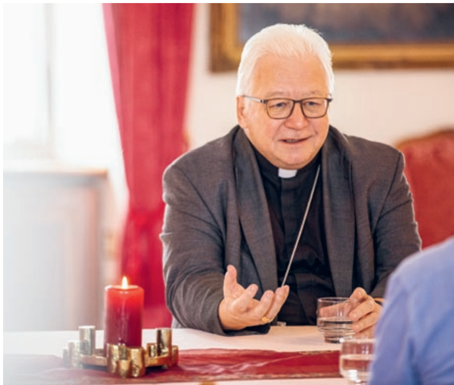
↑ Für Bischof Markus Büchel geht es im Advent darum, achtsam zu werden.

Wunder erwarten, wenn man eine Kerze anzündet. Aber es kann schon ein erster Schritt aus der Ohnmachtshaltung sein, mit einer Kerze die eigene Sprachlosigkeit auszudrücken. Wenn ich an einem Grab oder in der Kirche eine Opferkerze anzünde, dann ist das so als ob ich mein Gebetsanliegen oder meinen Gedanken in diesem Licht platziere. Auch wenn ich wieder weg bin, bleibt mein Anliegen dort.