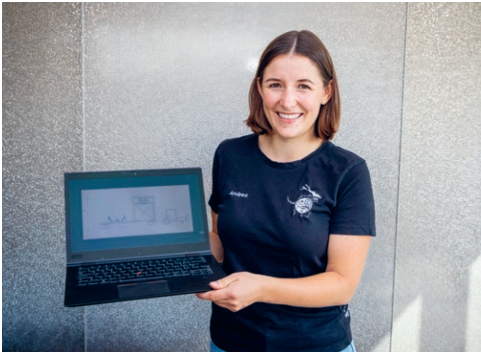
↑ Momentan gibt es erst eine erste Skizze vom Jubla-Olma-Wagen: Der Wagen wird erst kurz vor der Olma gebaut.

setzen, und viele Gruppenanlässe finden sowieso draussen in der Natur statt.»