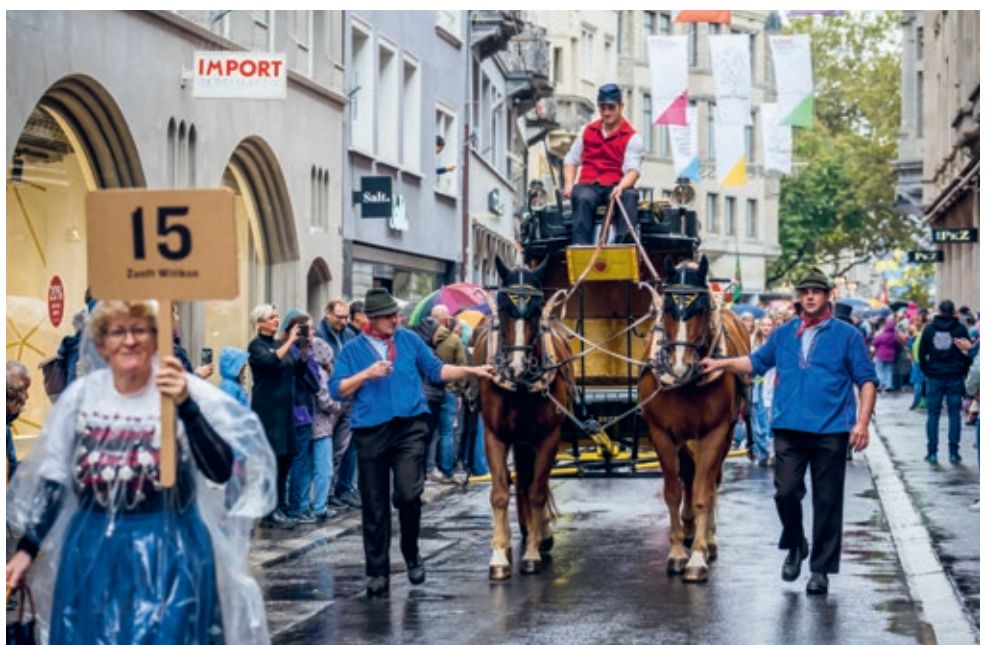
↓ Die Präsenz von Jubla am Olma-Umzug macht sichtbar, dass sich in der katholischen Kirche viele Jugendliche und junge Erwachsene freiwillig engagieren. (Aufnahme vom Umzug 2023, Michael Huwiler)

Trotz oder gerade wegen der Digitalisierung: Die Angebote der Jubla stossen in der Ostschweiz auf grosse Nachfrage. Vergleicht man die Mitgliederzahl von 2014 mit den aktuellen von 2024, so ist sie von 4445 Kindern und Leitungspersonen auf 4637 gewachsen – und der Zuwachs hält auch in diesem Jahr an. Hinzu kommen noch um die 110 Engagierte in Regionalleitungen, Kantonsleitung sowie Coaches und Kursleitende. Den Höchststand in den vergangenen zehn Jahren verzeichnete die Jubla Ost im Jahr 2020 mit 4953 Leitenden und Kindern.