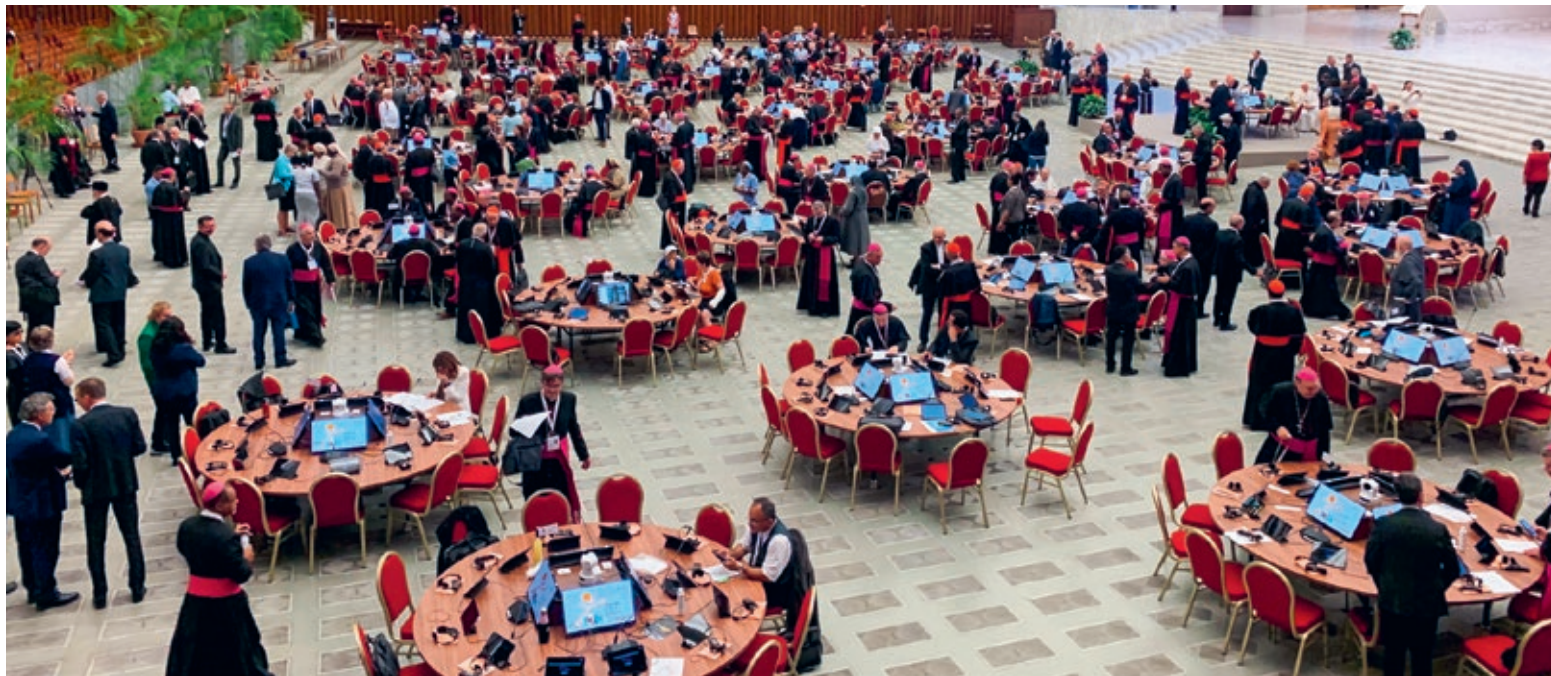
↑ Eine ganz neue Debattenkultur: Bei der Synode im Oktober 2023 diskutierten die Teilnehmenden an runden Tischen. Ein Symbol für einen kirchlichen Epochenwandel?

Frauenpriestertum, freiwilliges Zölibat, mehr Mitsprache aller Gläubigen – geht es jetzt endlich vorwärts? Im Oktober tagt in Rom die zweite und abschliessende Versammlung der Weltsynode. Es geht um Reformen und neue Mitwirkungsmöglichkeiten in der Kirche.